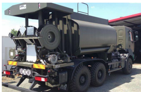
Avitailleur 10 000 litres