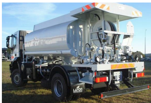
Avitailleur 10 000 litres