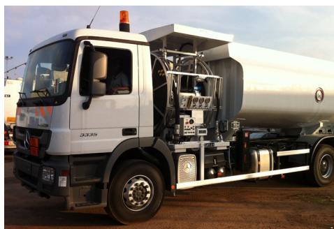
Avitailleur 20 000 litres