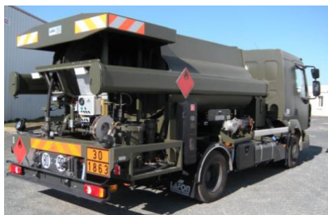
Avitailleur 2 950 litres