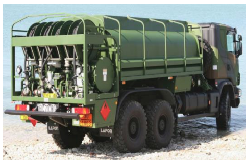
Avitailleur 10 000 litres