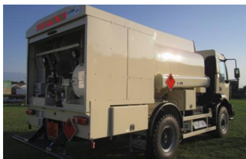
Avitailleur 5 000 litres